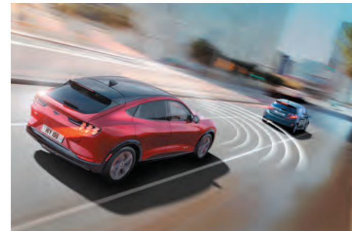
AKTYWNY TEMPOMAT Z FUNKCJĄ UTRZYMANIA POJAZDU NA ŚRODKU PASA RUCHU Standard dla wszystkich wersji