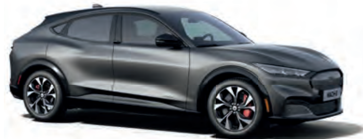
CARBONIZED GREY - LAKIER METALIZOWANY 5 000,-