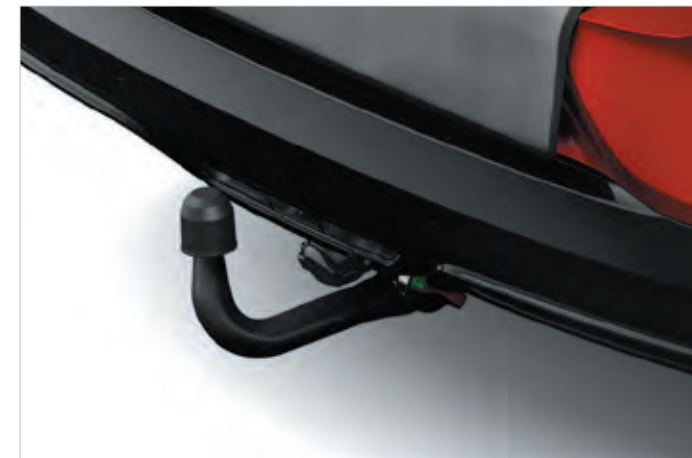
HAK HOLOWNICZY - ODŁĄCZANY (2 483 493)