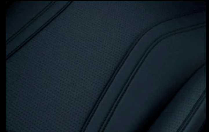
TAPICERKA PERFOROWANA SENSICO Dla wersji RWD opcja dostępna w pakiecie Technology Plus