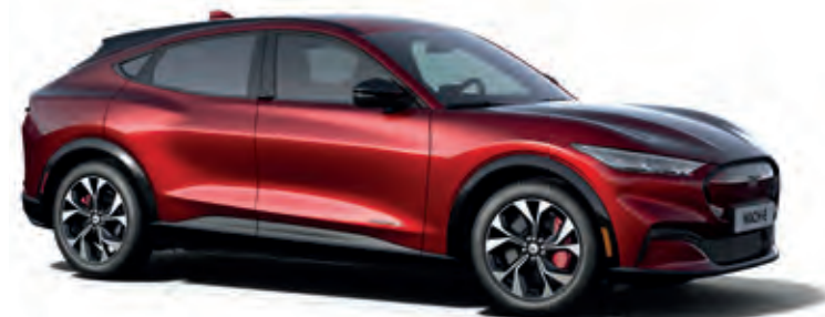
LUCID RED- LAKIER METALIZOWANY SPECJALNY 5 000,-