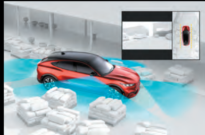
SYSTEM KAMER 360 STOPNI Opcja dostępna w pakietach Technology oraz Technology Plus