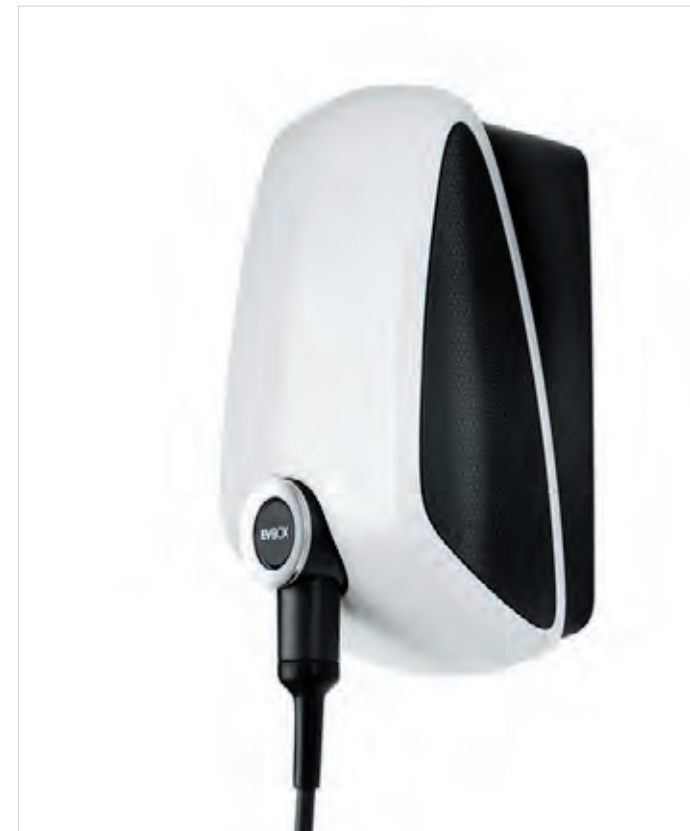
ELVI ŁADOWARKA ŚCIENNA WALLBOX Z ZAMONTOWANYM NA STAŁE KABLEM (2 443 729)

Inteligentne i wydajne rozwiązanie do ładowania w domu Twojego w pełni elektrycznego lub hybrydowego Forda. Bezpiecznie ładuje nawet do trzech razy szybciej niż w zwykłym gniazdku elektrycznym.