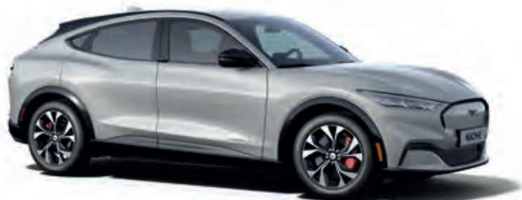
SPACE WHITE - LAKIER METALIZOWANY 3 400,-