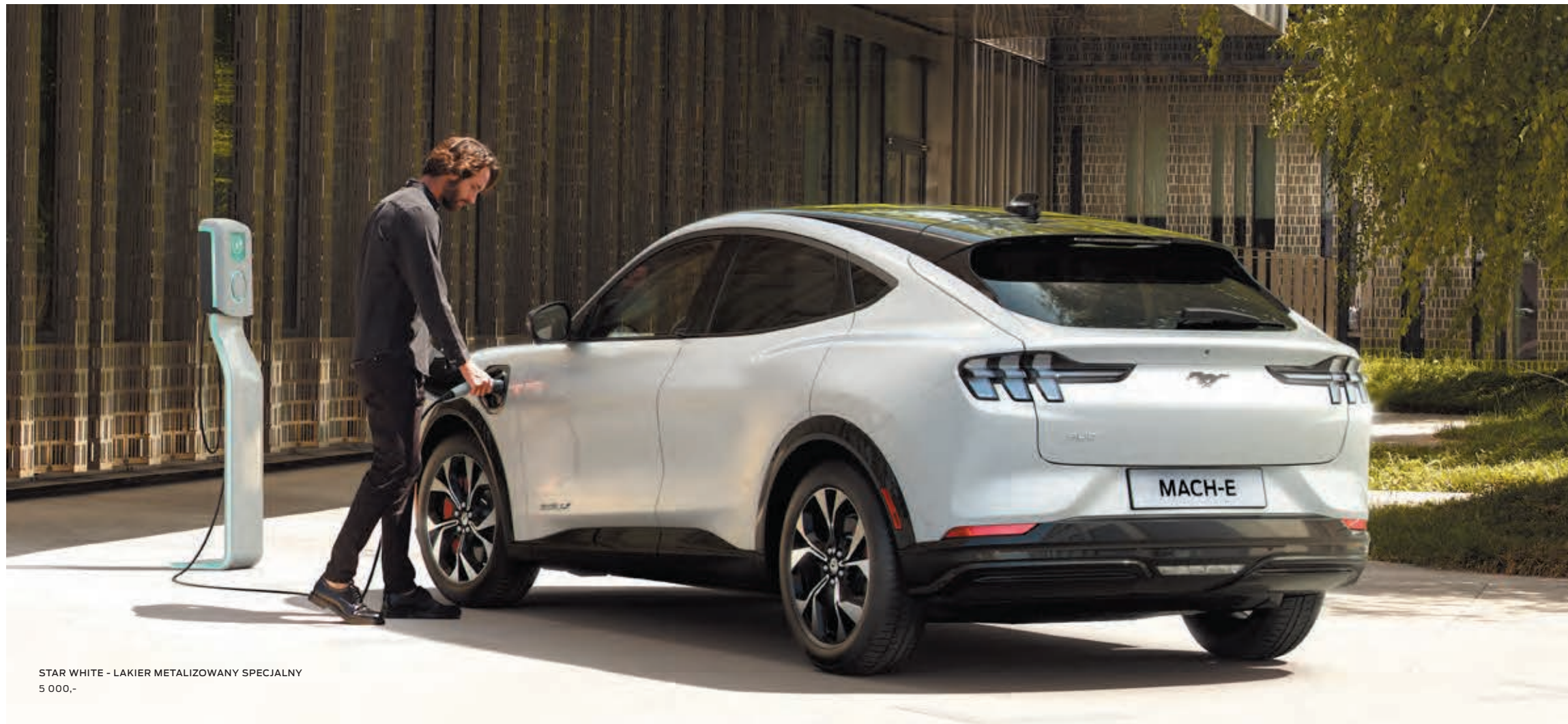
STAR WHITE - LAKIER METALIZOWANY SPECJALNY 5 000,-

FORD MUSTANG MACH-E | AWD | KOLOR NADWOZIA STAR WHITE (OPCJA) | SAMOCHÓD NA ZDJĘCIU WYPOSAŻONY W DACH PANORAMICZNY (OPCJA)