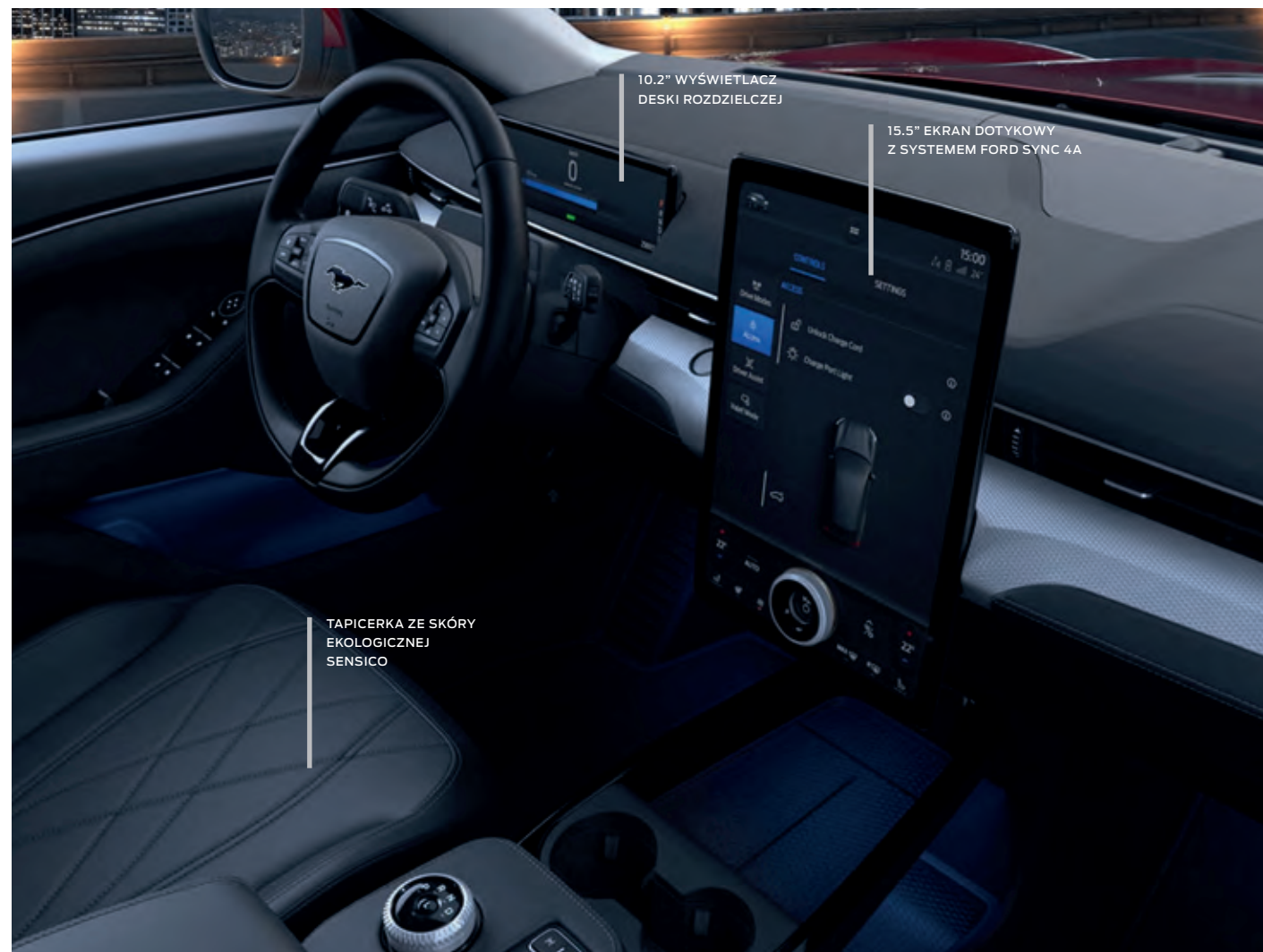
FORD MUSTANG MACH-E | RWD