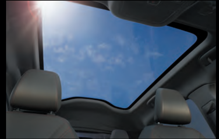
DACH PANORAMICZNY Opcja dostępna w pakiecie Technology Plus