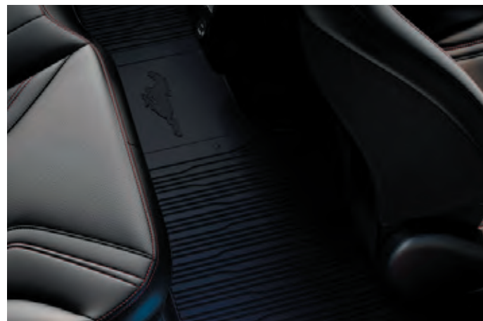
DYWANIKI PODŁOGOWE, GUMOWE - Z PRZODU I Z TYŁU (2 526 939)