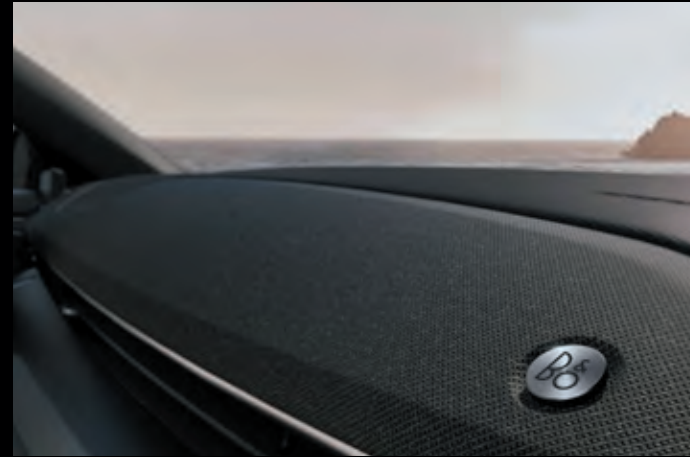
SYSTEM NAGŁOŚNIENIA B&O Opcja dostępna w pakietach Technology oraz Technology Plus