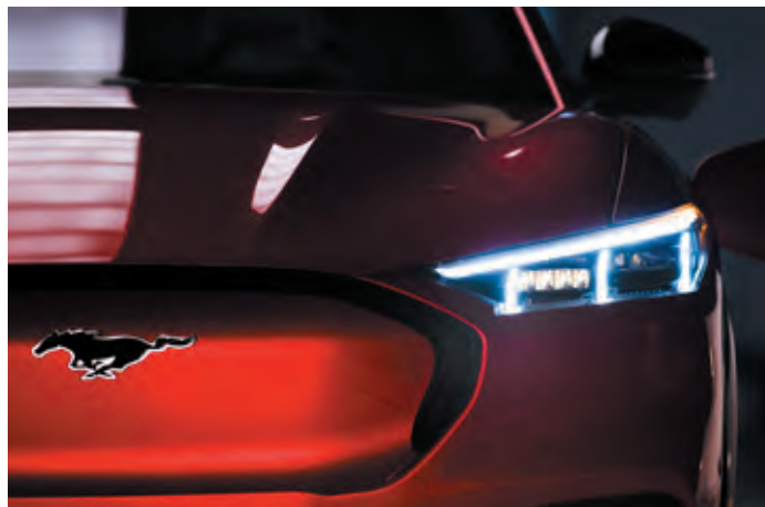
REFLEKTORY PROJEKCYJNE LED Standard dla wersji AWD