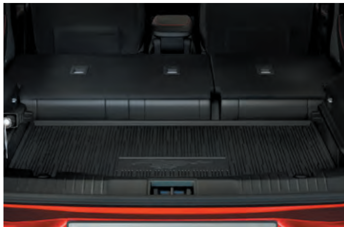
MATA GUMOWA DO BAGAŻNIKA Z LOGO MUSTANGA (2 465 296)