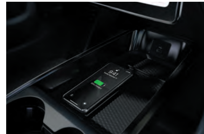
BEZPRZEWODOWA ŁADOWARKA Standard dla wszystkich wersji