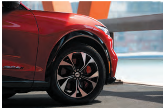
OSŁONY NADKOLI LAKIEROWANE W KOLORZE CZARNYM Standard dla wersji AWD