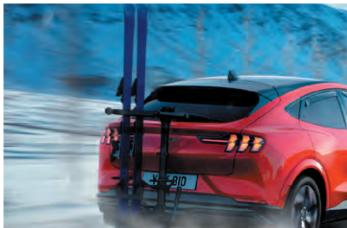
UCHWYT NA NARTY MONTOWANY DO HAKA HOLOWNICZEGO (2 483 279)