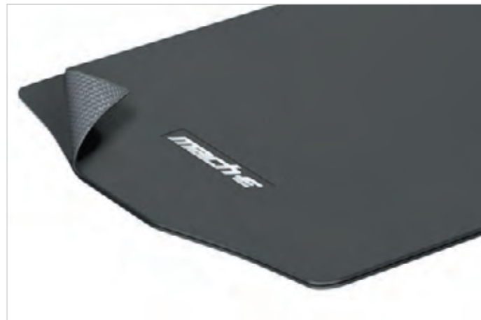
MATA DWUSTRONNA DO BAGAŻNIKA Z DODATKOWĄ OCHRONĄ ZDERZAKA (2 482 274)