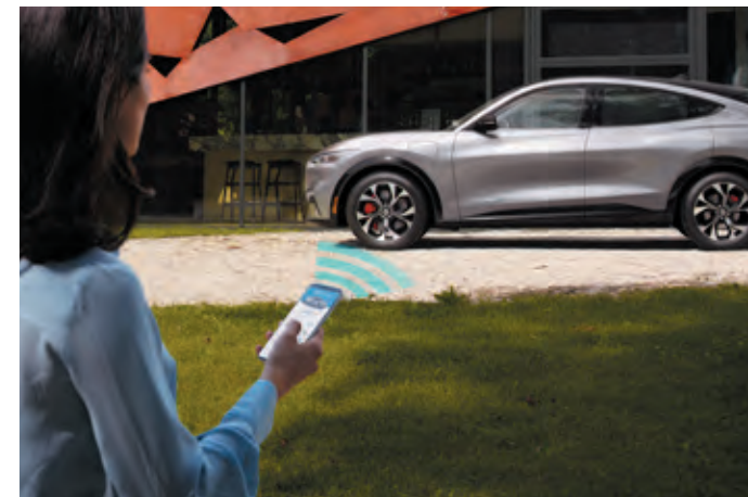
FUNKCJA OTWIERANIA, ZAMYKANIA ORAZ URUCHAMIANIA POJAZDU ZA POMOCĄ SMARTFONA Standard dla wersji AWD