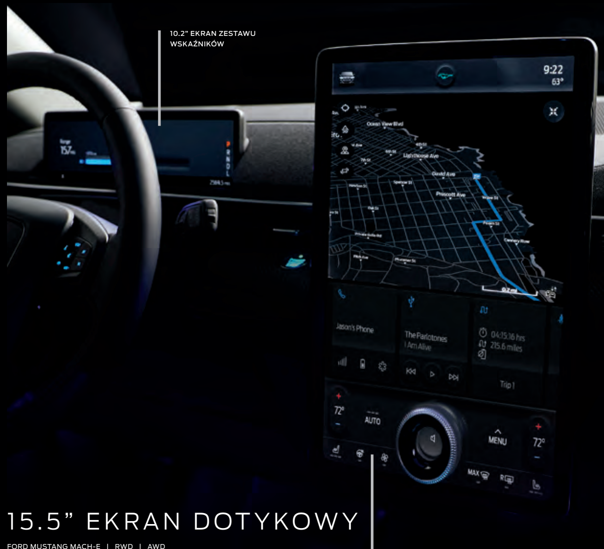
10.2" EKRAN ZESTAWU WSKAŹNIKÓW