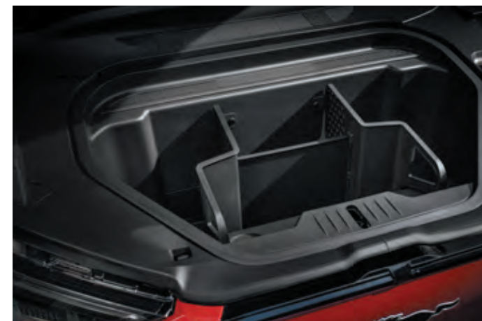
DODATKOWY BAGAŻNIK Z PRZODU POJAZDU O POJEMNOŚCI 81 LITRÓW Standard