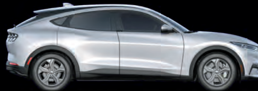
FORD MUSTANG MACH-E | RWD | KOLOR NADWOZIA: SPACE WHITE (OPCJA)