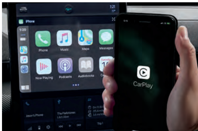
BEZPRZEWODOWA OBSŁUGA APPLE CARPLAY I ANDROID AUTO Standard dla wszystkich wersji. Wymaga kompatybilnego urządzenia.