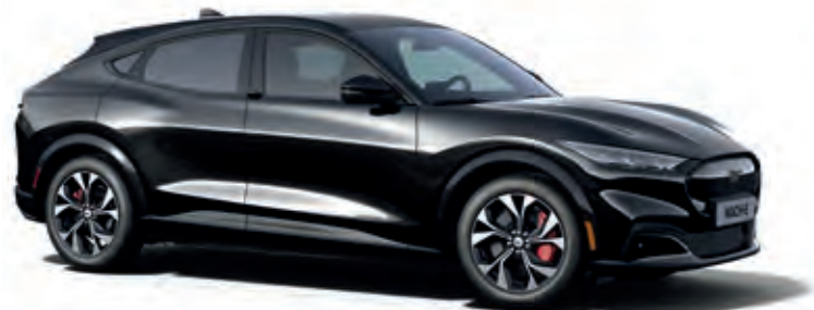
SHADOW BLACK - LAKIER SPECJALNY bez dopłaty