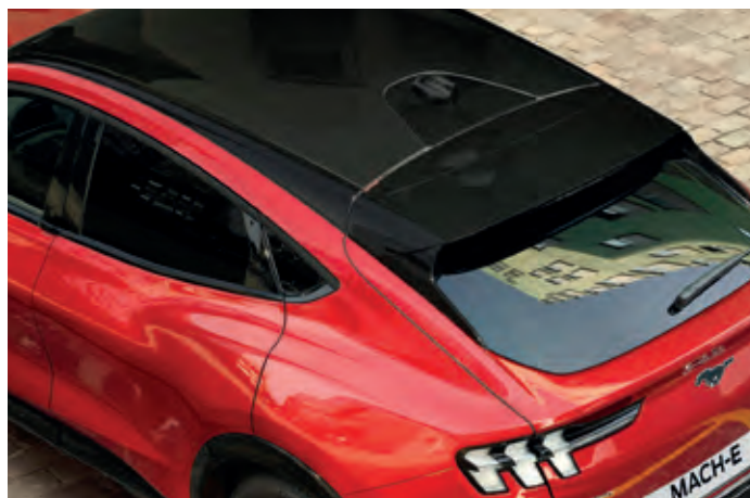
DACH PANORAMICZNY - NIEOTWIERANY Opcja dostępna w pakiecie Technology Plus