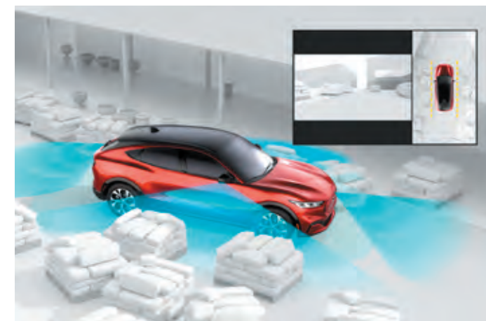
SYSTEM KAMER 360 STOPNI Opcja dostępna w pakietach Technology oraz Technology Plus