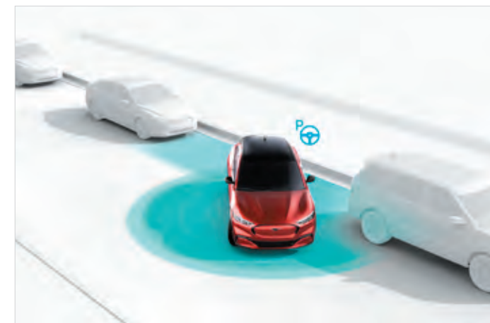
ACTIVE PARK ASSIST 2 Opcja dostępna w pakietach Technology oraz Technology Plus