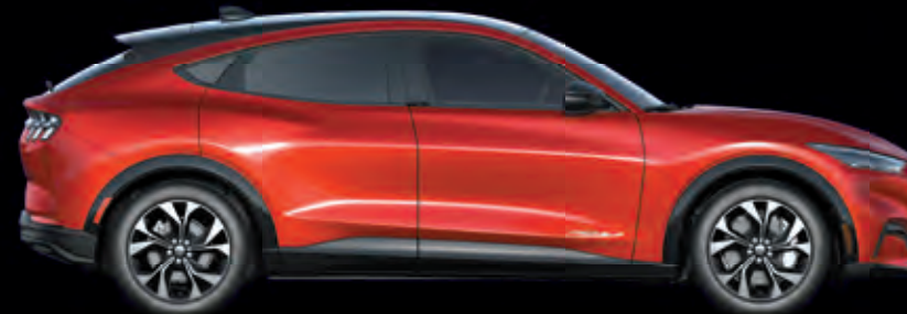
FORD MUSTANG MACH-E | AWD | KOLOR NADWOZIA: LUCID RED (OPCJA)