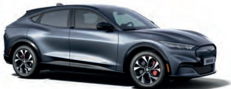
INFINITY BLUE- LAKIER METALIZOWANY SPECJALNY 4 200,-